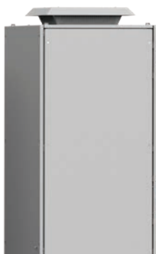
Venkovní Stropní Ventilací Jednotka RFU