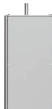
Interiérové/Venkovní Vírové Trubice HT/BP