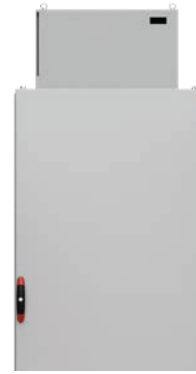
Condizionatore d'aria montato sul tetto

Questa unità di raffreddamento per esterni a montaggio verticale, E-NOX, con grado di protezione IP55, è disponibile in più formati per soddisfare diverse esigenze di raffreddamento. L'unità di raffreddamento è facile da installare ed è disponibile anche in acciaio inossidabile per l'utilizzo negli ambienti più impegnativi.