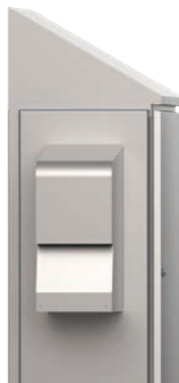
Condizionatore d'aria per ambienti estremi

I condizionatori d'aria Slim Fit sono facili da impostare e pronti per l'uso. Questi condizionatori d'aria offrono una flessibilità ottimale e possono essere montati all'esterno, semi-incassati o incassati completamente, a seconda dello spazio disponibile.