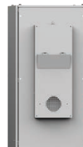
Scambiatori di calore

L'unica unità del settore a offrire un grado di protezione IP66 e IP69.