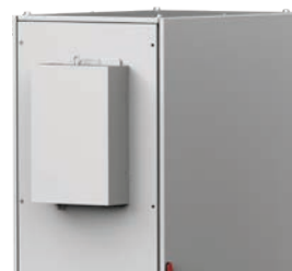
Scambiatori di calore acqua-aria

Con potenze che vanno da 900 W a 134 kW, sono disponibili modelli adatti per qualsiasi applicazione. L'ampia gamma di opzioni e accessori consente più configurazioni di refrigeratori.