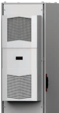
Unità di raffreddamento salvaspazio per interni

Questa unità di raffreddamento per tetto, DEK, con grado di protezione IP54, è in grado di raffreddare un solo armadio o un intero gruppo, a seconda dei requisiti di raffreddamento e del livello di consumo energetico desiderato. È posizionata sulla parte superiore dell'armadio ed è perfetta quando lo spazio sullo sportello o sui pannelli laterali non è sufficiente.