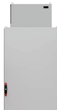
Klimatyzator do montażu na dachu

Nasza pionowa jednostka chłodząca do użytku zewnętrznego E-NOX o stopniu ochrony IP55 jest dostępna w wielu różnych rozmiarach dostosowanych do różnych wymagań w zakresie chłodzenia. Jednostka chłodząca jest łatwa w instalacji i dostępna w wersji ze stali nierdzewnej do wymagających środowisk.