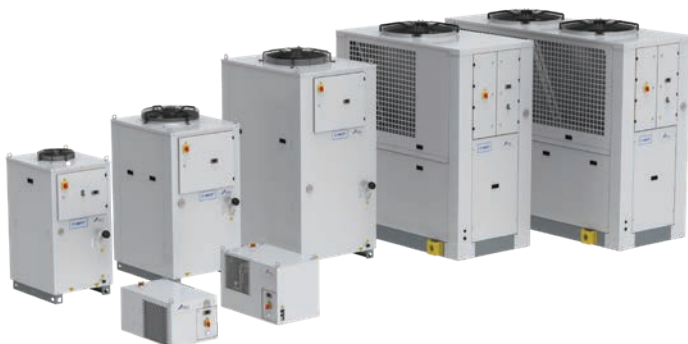
Przemysłowy miniagregat chłodniczy