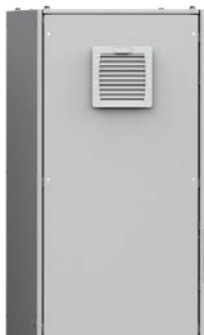
Pionowe wentylatory do użytku wewnętrznego/zewnętrznego EF/EPF