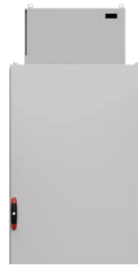
Unidade de ar condicionado de montagem no teto DEK

Esta unidade de arrefecimento vertical exterior, E-NOX, com um grau de proteção IP55, está disponível em vários tamanhos para diferentes requisitos de arrefecimento exterior. A unidade de arrefecimento é fácil de instalar e também está disponível em aço inoxidável para ambientes exigentes.