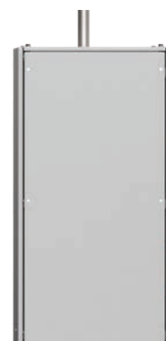
Vortex, interior/exterior HT/BP