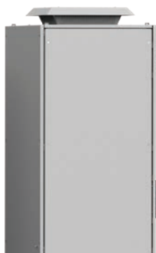
Unitate de ventilație, pentru exterior, acoperiș RFU