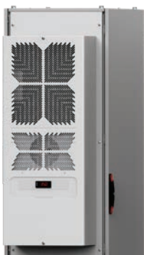
Aparat de aer condiționat cu montare verticală, în interior E-NEXT

Această unitate de răcire E-NEXT, cu montare verticală și grad de protecție IP55, este disponibilă în numeroase dimensiuni diferite, pentru diverse cerințe de răcire. Acest lucru înseamnă că soluția potrivită de răcire poate fi aleasă cu ușurință, inclusiv confecționată din oțel inoxidabil pentru medii dificile.