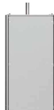
Vortexkylenhet för inom-/utomhusbruk HT/BP