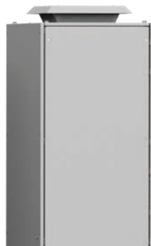
Takfläktenhet för utomhusbruk RFU